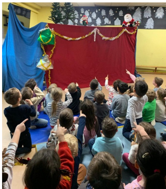
Spectacle de marionnettes