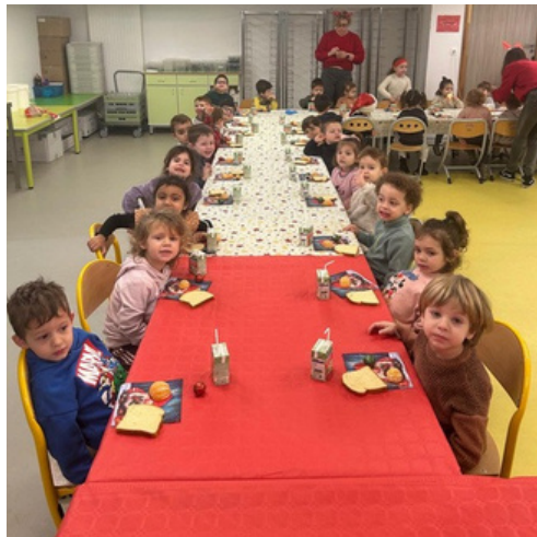
Goûter de Noël