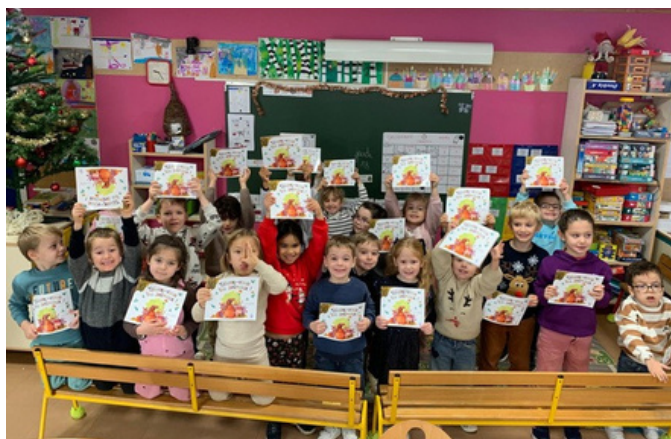
Le père Noël a déposé des livres pour les enfants.