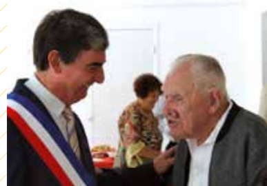
Remise de la médaille de la Ville par le Maire en septembre 2019.